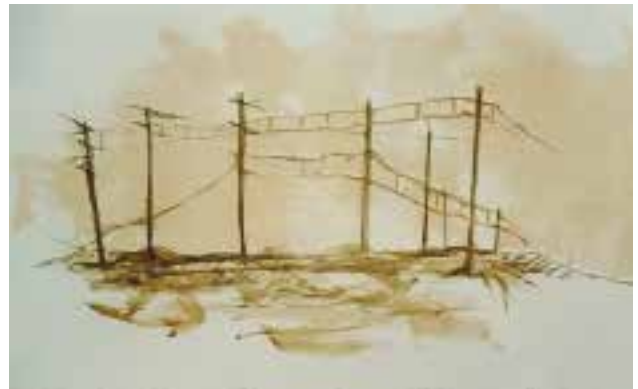
María Pavés. S/T. Litografía.

Materiales: Rodillo, tinta negra, vidrio (para esparcir la tinta), goma eva, bolígrafo, tijeras, bastidores de acetato.