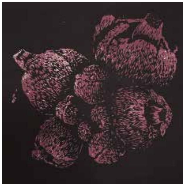
Lucía Hernández. S/T. Xilografía.

Materiales: Tampones de tinta, matrices de goma eva, papeles blancos, bolígrafos, cuentahílos, tijeras, formas naturales para observar.