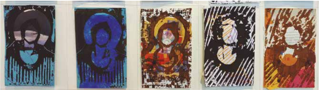
Autora (2023) Autorretrato a partir de la obra de José Pedreros. Foto ensayo compuesto por cuatro fotografías, de arriba a abajo, Autora (2022) Atención, Creando un collage, matriz sobre soporte y Autorretrato.