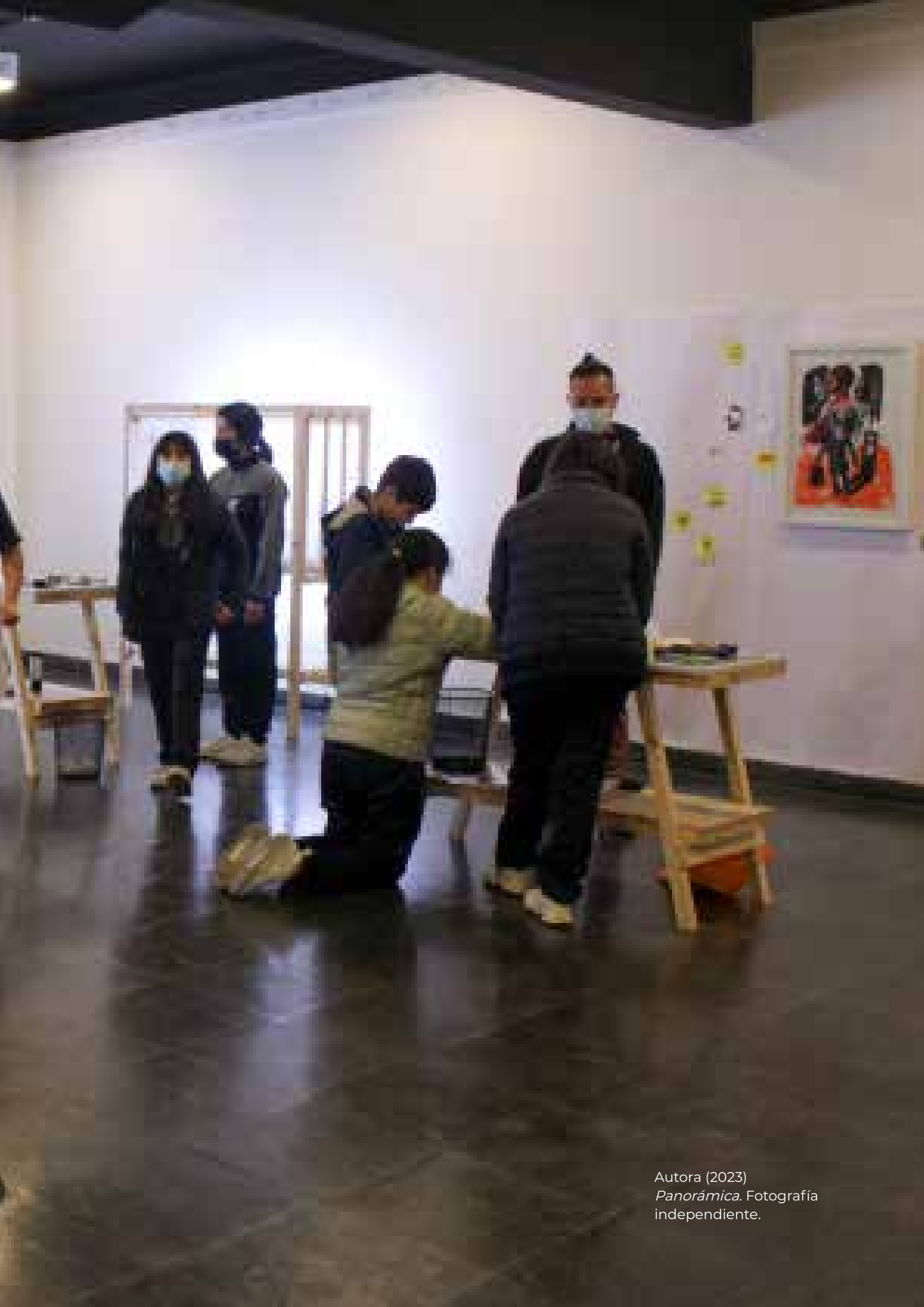
Autora (2023) Panorámica . Fotografía independiente.