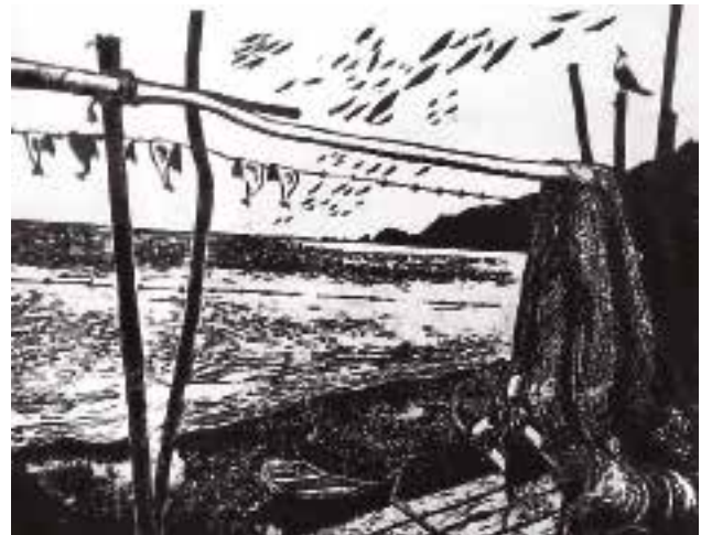
Américo Caamaño. Caleta Cocholgüe . Xilografía.

Materiales: Telas con forma sintética de pez, texturas diversas, tampones de tinta, tinta.