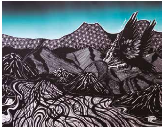
Tatiana Binimelis. S/T . Xilografía.

Materiales: Tampones de tinta, texturas diversas, papeles blancos, cinta masking.