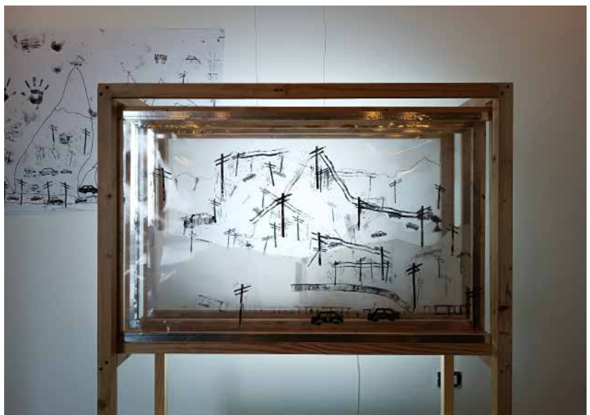
Autora (2023) Creando un paisaje en planos a partir de la obra de María Pavés. Foto ensayo compuesto por cuatro fotografías, de arriba a abajo, Autora (2022) Materiales, Estampa en acetato, Estampa translúcida y Caja.