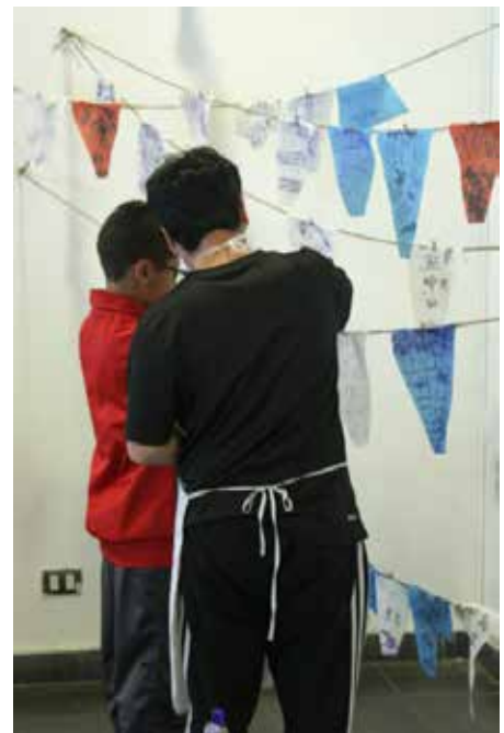
Autora (2023) Texturando la forma de un pez a partir de la obra de Américo Caamaño . Foto ensayo compuesto por tres fotografías, de arriba a abajo, Autora (2022) Tela, Textura y Colgar .