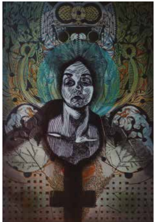
José Pedreros. S/T. Serigrafía.

Materiales: Rodillos, tinta, soporte para tinta, matrices con la forma de la obra, papeles de colores, lápices, rotuladores, tijeras, pegamento.